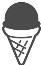
an ice cream